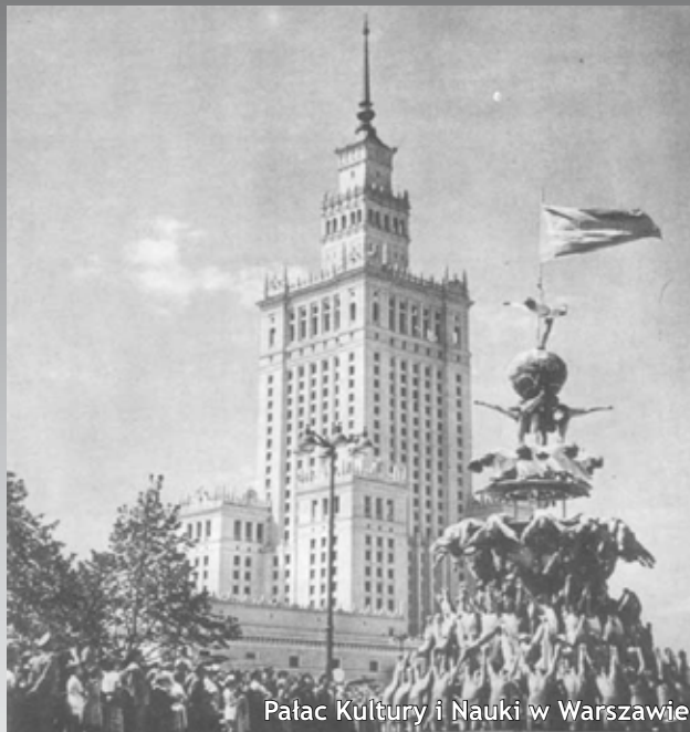
Pałac Kultury i Nauki w Warszawie

My, młodzi z Niemiec i z Polski, pracowaliśmy nad historycznym projektem „Całkiem Zwykli Bohaterowie”, poznając przy tym losy Opozycjonistów z czasów NRD i PRL, oraz pogłębiając wzajemne zrozumienie między naszymi krajami. Pytaliśmy Świadków tamtych wydarzeń m.in. o ich wspomnienia z czasu młodości, momentu aresztowania, o pobyt w więzieniu oraz działalność polityczną.