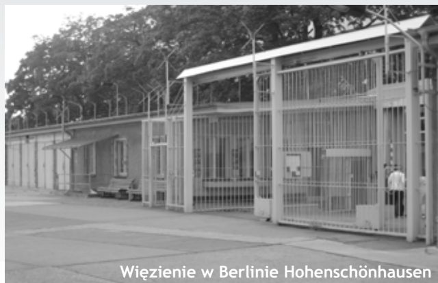
Więzienie w Berlinie Hohenschönhausen

Wyniki naszej pracy przedstawimy podczas wernisaży w Berlinie oraz w Warszawie. Zaprezentujemy biografie Świadków na tle społeczno-politycznego konfliktu między Wschodem a Zachodem. Nasze bimedialne wystawy zostaną po raz pierwszy pokazane publiczności w ważnych dla tego okresu historycznych miejscach: w Berlinie Hohenschönhausen, byłym więzieniu Stasi, w Warszawie zaś w Pałacu Kultury i Nauki. Następnie będzie można je obejrzeć w innych miejscach.