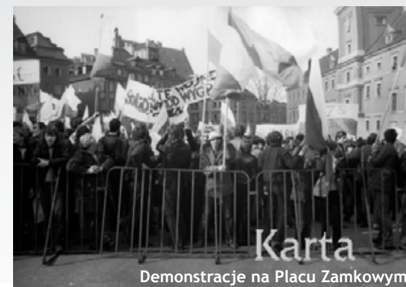
Karta Demonstracje na Placu Zamkowym

Nasi Świadkowie byli opozycjonistami w PRL i NRD. Mimo tego, że ich biografie się różnią, podzielili oni ten sam los: siedzieli w więzieniu, gdyż odważnie przeciwstawiali się ówczesnemu systemowi politycznemu, walczyli o poszanowanie godności i praw człowieka. Ci Całkiem Zwykli Bohaterowie byli więzieni w Berlinie Hohenschönhausen lub w warszawskiej Białolece.